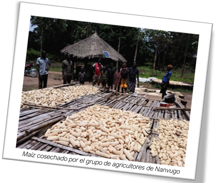
Maíz cosechado por el grupo de agricultores de Nanvugo

El grupo de agricultores de Nanvugo es uno de los grupos de agricultores más comprometidos y apoyados por el SAP-R en la aldea de Kasia, en el condado de Riimenze Boma Yambio. Formado en 2014, el grupo cuenta con 12 miembros, cuatro mujeres y ocho hombres, con una finca de 12 acres plantada con yuca, maíz, mijo y g/nuez en la primera temporada de siembra de este año 2022. De la cosecha, el grupo consiguió obtener 2.000 kg de g/nuez y 1.500 kg de maíz, respectivamente. Están esperando un mejor momento para vender los productos a un precio más alto. Al igual que los demás grupos, Nanvugo recibe toda la formación técnica del SAP-R a través de los servicios de divulgación.