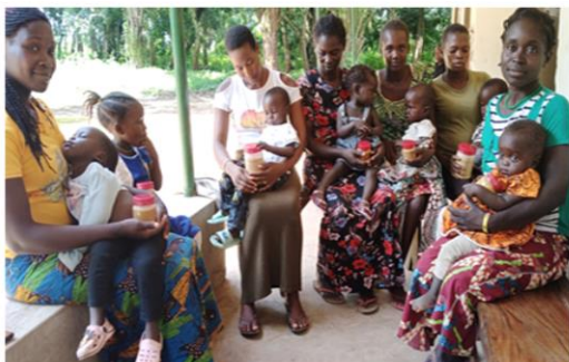
Las madres después de la distribución de la pasta de soja