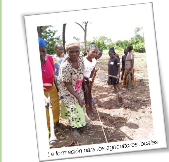
La formación para los agricultores locales

La newsletter mensual es uno de los instrumentos utilizados por la Comunidad de Riimenze promovida por Solidarity para compartir y contar las actividades en curso.