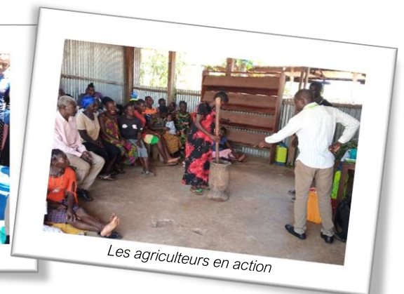
Les agriculteurs en action