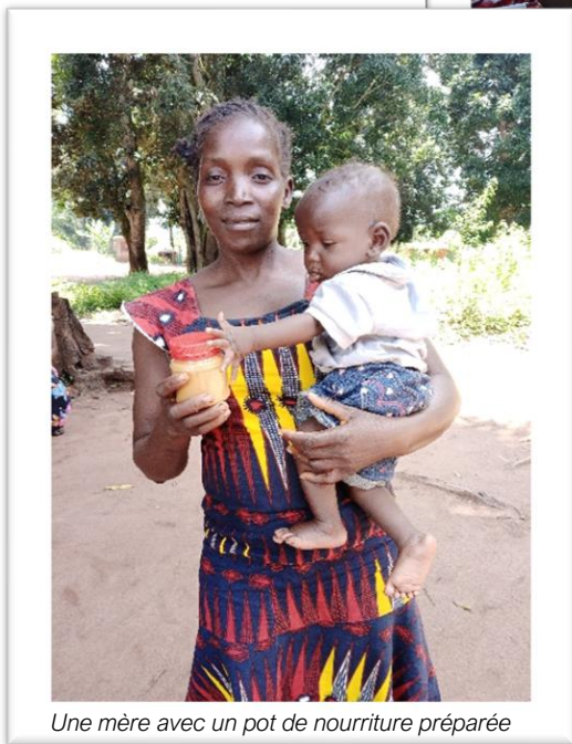
Une mère avec un pot de nourriture préparée