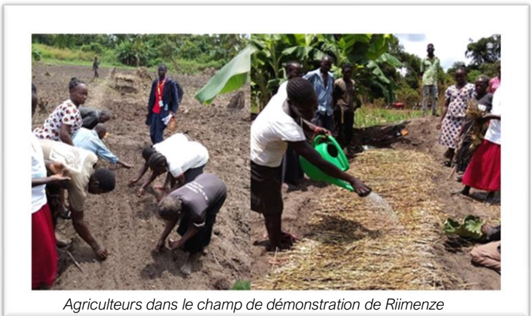
Agriculteurs dans le champ de démonstration de Riimenze