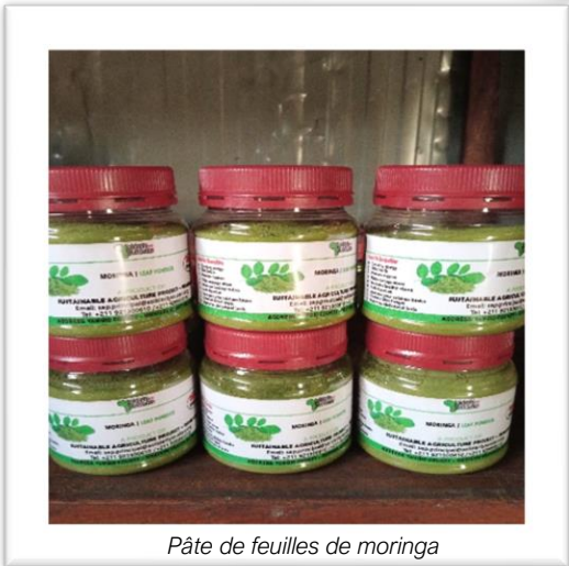
Pâte de feuilles de moringa