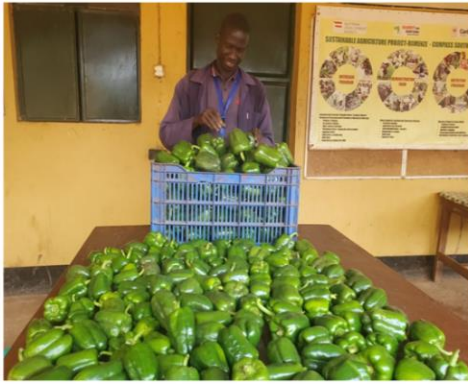
Cosecha de pimientos dulces