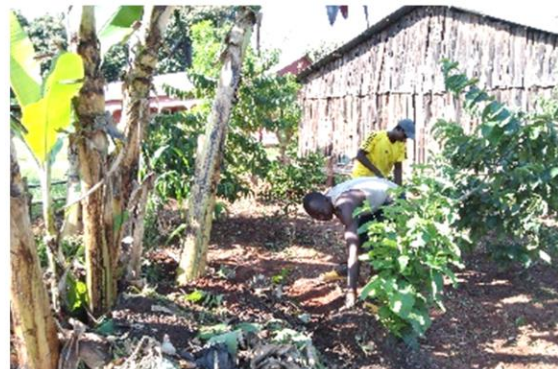
Lavori di pulizia e piantumazione nel campus

Paul's School quiere agradecer a la granja SAP la donación de semillas de papaya y plátanos para poder plantar más. ¡Esperamos que las semillas sean fructíferas para que podamos alimentar a todos los estudiantes!