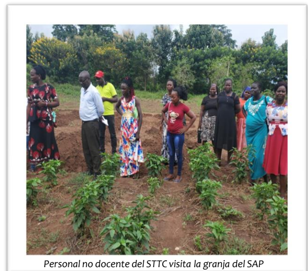
Personal no docente del STTC visita la granja del SAP

El 14 de septiembre de 2023, un total de 17 miembros del personal no docente del Solidarity Teacher Training College - 5 hombres y 12 mujeres- visitaron la granja de demostración del SAP-R, muchos de ellos por primera vez. Los visitantes recorrieron todas las unidades de la granja, desde las hortalizas hasta el ganado. El grupo se mostró entusiasmado con la experiencia, que consideró informativa e inspiradora. Algunas de las mujeres se propusieron abrir huertos en sus casas a su regreso.