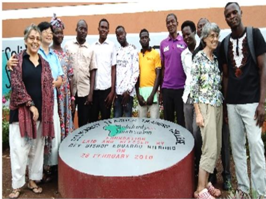
El personal de la Escuela Saint Paul en el STTC

Durante las vacaciones, también se construyó una nueva estufa de bajo consumo para ahorrar leña y preservar así el medio ambiente, como parte de nuestro esfuerzo por reducir el impacto del cambio climático, en respuesta a la petición de nuestro Santo Padre, el Papa Francisco en Laudato Si'. Los alumnos volvieron a las clases el 11 de septiembre. Todos los lunes y viernes celebran una asamblea para rezar y cantar juntos.